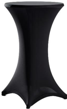
Tischplatte Ø 70 cm → andere Hussefarben (blau, rot, weiß) auf Anfrage