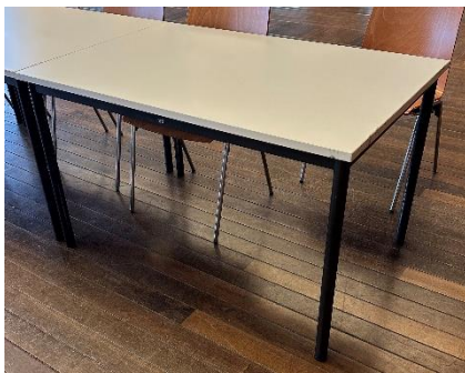
120 x 80 x 76 cm (B x T x H)