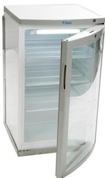
51 x 57 x 85 cm (B x T x H)