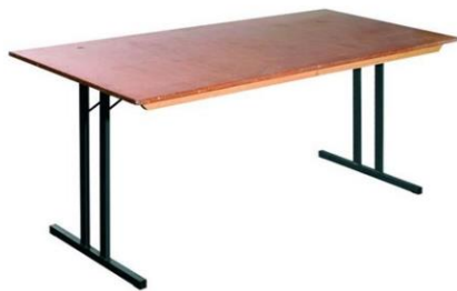
180 x 80 x 76 cm (B x T x H)