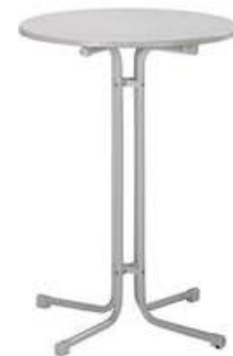
Tischplatte Ø 70 cm

Alle genannten Preise beziehen sich auf eine Mengeneinheit, verstehen sich zzgl. MwSt und gelten für die gesamte Messedauer. Ab 17.9.2024 Verfügbarkeit auf Anfrage.