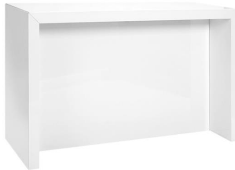
180 x 70 x 108 (B x T x H)