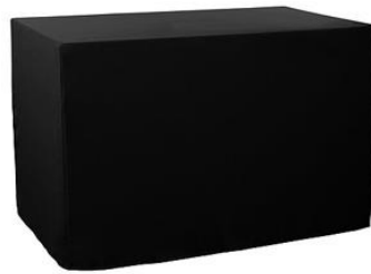
180 x 80 x 76 cm (B x T x H) dreiseitig geschlossen