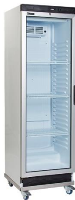
59 x 66 x 193 cm (B x T x H)